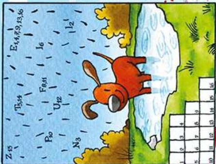
Illustrationen: Deike, Shutterstock

Oscar spielt im Regen. Sortiere die Buchstaben so, wie es die Zahlen vorgeben. Dann erfährst du, worüber sich Oscar freut.